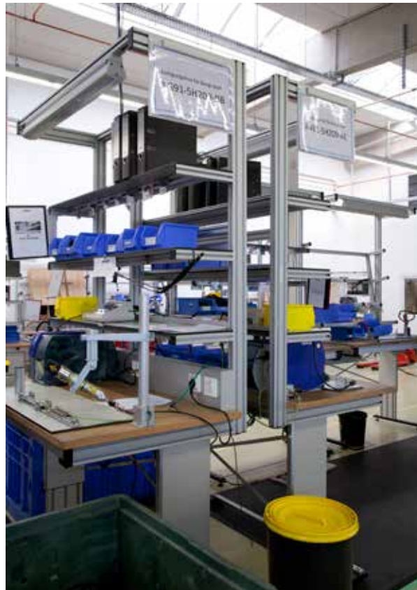
Kavlico nutzt RK Easywork-Arbeitstische in der Ausführung „elektrisch höhenverstellbares Zwei-Säulensystem“ mit arbeitsplatzspezifisch eingerichteten Portalen