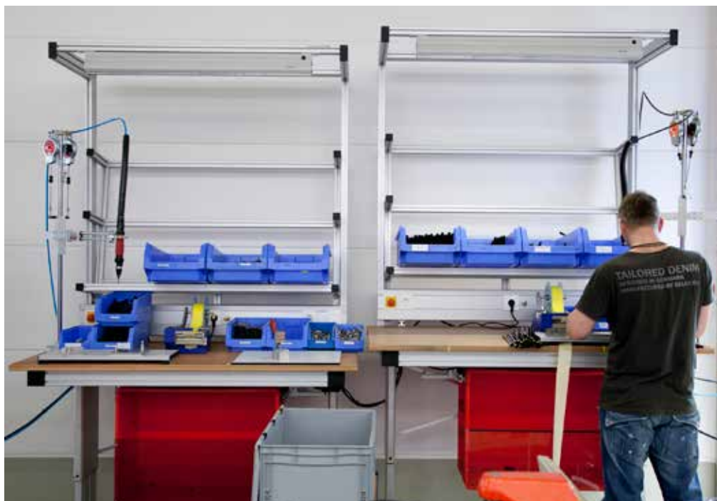
Je nach Körpergröße des Monteurs lässt sich die Höhe der Tische anpassen – das schont die Gesundheit der Mitarbeiter