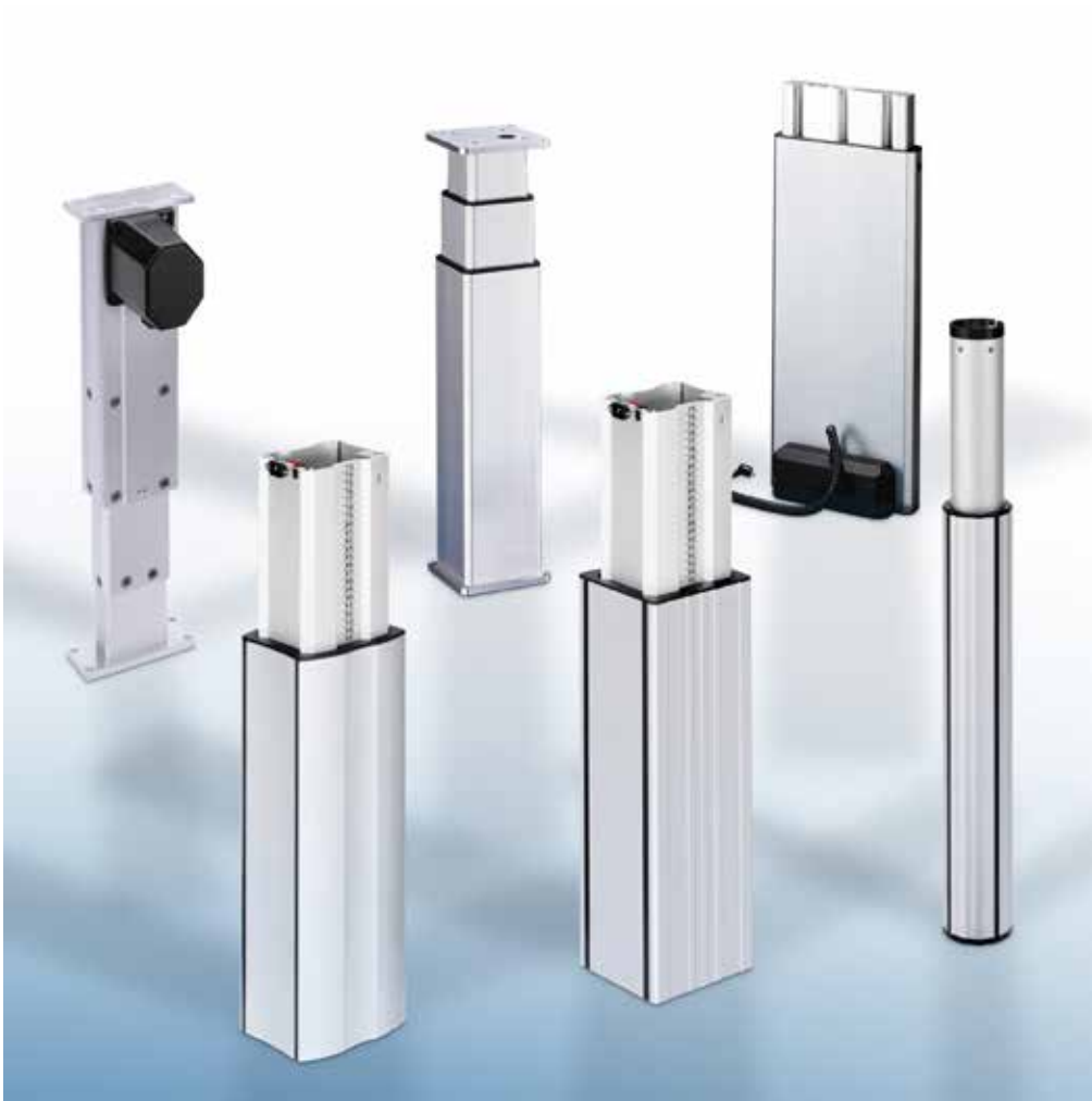
Elektromotorisch betriebene Hubsäulen sind die Basis für die höhenverstellbaren RK Easywork-Arbeitstische